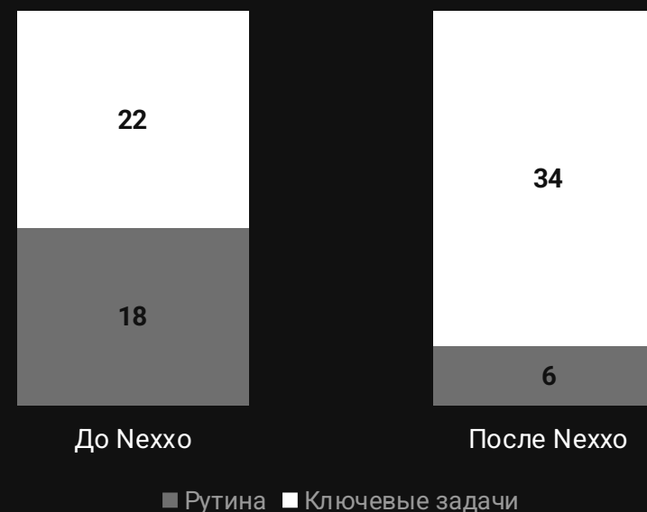
РАБОЧЕЕ ВРЕМЯ, Ч/НЕД (ИЗ 40)